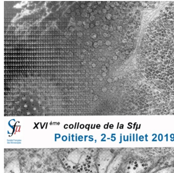
Figure 1: figures should be centered on the second page, caption written in Arial 10 Italic and centered.